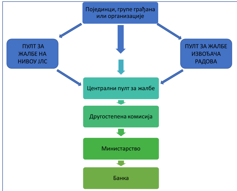
Слика 1. Шема функционисања жалбеног механизма

доноси Другостепена комисија образована решењем министра грађевинарства, саобраћаја и инфраструктуре. Организација ЖМ-а је представљена на слици 1 овог документа.